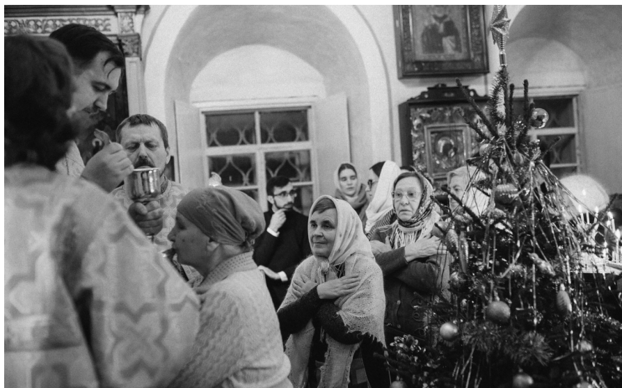
Литургия, Рождественская ночь, Матигоры, зима 2023 г.

В канун Крещения (Крещенский Сочельник) соблюдался строгий пост. При подготовке к празднику мужчины вырезали прорубь, называемая Иордань, с формой креста. Часто ставили вырезанный из льда крест у проруби, где совершалось ночное праздничное богослужение. Во время того, как священник совершал чин освящения воды, жители деревни выстраивались с зажженными свечами вокруг проруби. После освящения люди набирали воду прямо из проруби.