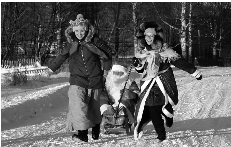
Экспедиция в Турчасово, зима 2019г.