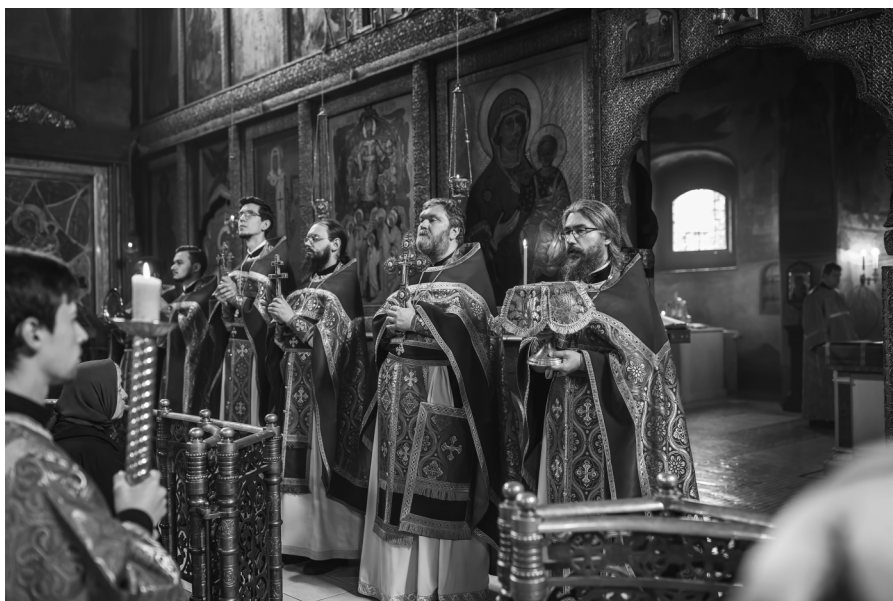
Литургия «Родной земли» в Сретенском монастыре, г. Москва, май 2023 г.