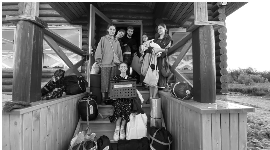
Экспедиция в Архангельскую область, г. Северодвинск, лето 2023г.

Опыт показывает, что для избежания потерь каждый волонтер должен до начала поездки составить опись личных вещей в письменном виде, а в конце экспедиции проверить по списку — ничего ли не забыто.