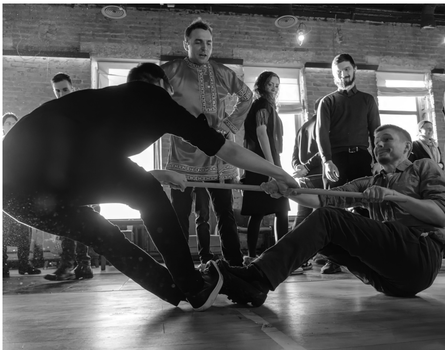
«Масленица», традиционные русские народные игры, Москва 2021 г.

А мы масленку дажидали дажидали, люли дажидали. Сыра с маслом саблюдали, саблюдали, люли, саблюдали. Мы на горку ванасили, ванасили, люли, ванасили. Сыром горку набивали набивали, люли, набивали. Сверху маслом паливали, паливали, люли, паливали А от сыра гора крута, гора крута, люли, гора крута. А от масла гора ясна гора ясна, люли, гора ясна.