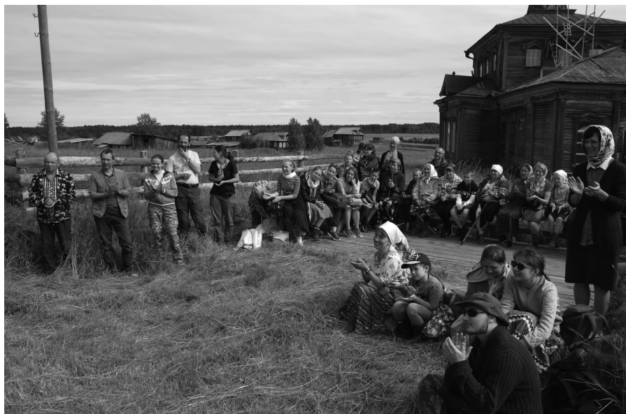
Деревня Большая Фёхтальяма, Архангельская область, лето 2019 г.

После праздничного богослужения большинство людей шли на ярмарку, где покупали лакомства для гостей, а молодежь заводила хоровод. Принимали гостей, приезжавших из окрестных деревень, для чего в некоторых местах стол оставался накрытым целый день. Каждая крестьянская семья принимала своих гостей — родственников и знакомых.