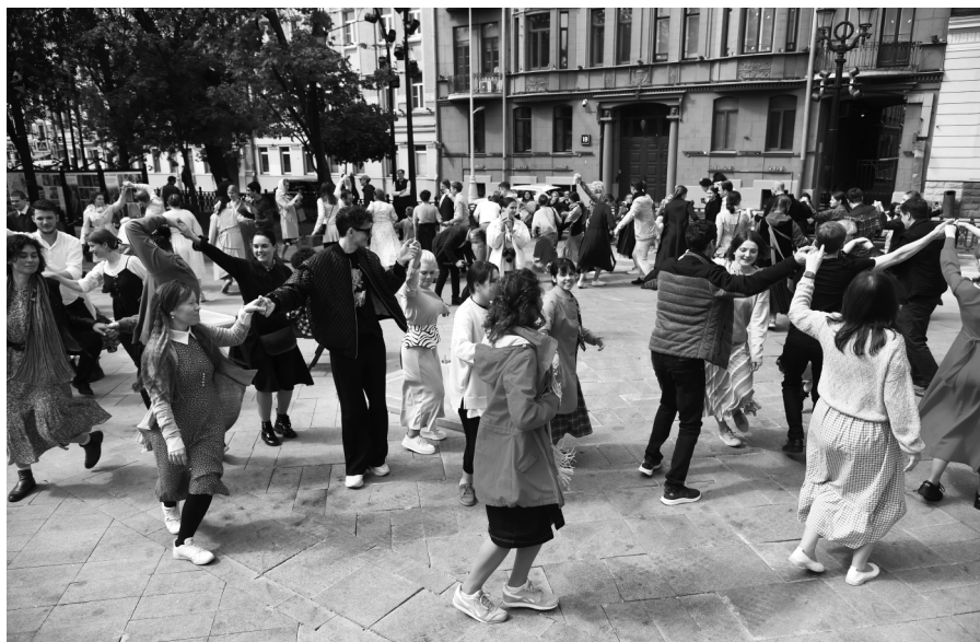
Вечёрка с народными танцами на Рождественском бульваре, Москва 2023г.

Далее движения повторяются снова с начала. Скорость смены движений ведущий определяет сам, он может постепенно увеличивать скорость, или уменьшать её.