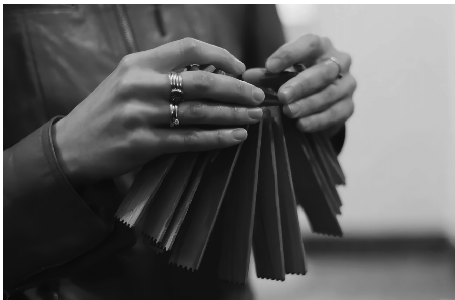
Трещотка – русский народный ударный музыкальный инструмент