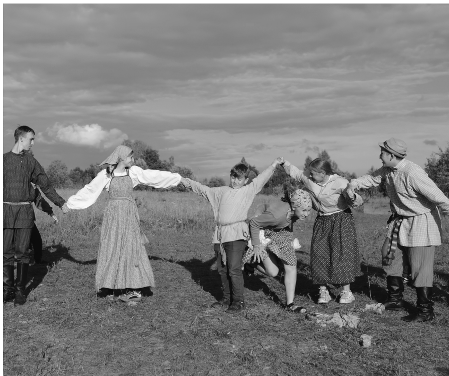
Фигура «воротца». Экспедиция в Изборск, лето 2023 г.

Как только пара выполнила задание музыка снова начинает играть, пара, выполняющая задание, бежит в «воротца» и снова все пары начинают бегать и меняться местами. Игра продолжается. Если количество играющих слишком большое, то первыми водящими могут быть одновременно две-три пары.