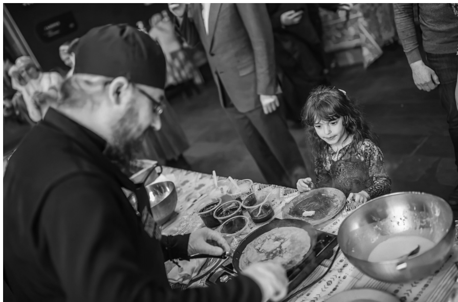
Мероприятие «Масленица», приготовление блинов для гостей, Москва 2021 г.

В первые три дня хозяйкам можно было заниматься домашними делами. С четверга все работы прекращались, и начиналась Широкая Масленица. В эти дни любые работы по хозяйству и по дому запрещались. Разрешалось только развлекаться и печь блины. Каждый день масленичной недели имеет свое название и наполнен смыслом. В первый день масленичной недели начинали печь блины. Первый блин по традиции отдавали нищим, бедным и нуждающимся людям. В последующие дни катались с горок, на качелях и каруселях, устраивали веселые катания на лошадях, в санях, играли