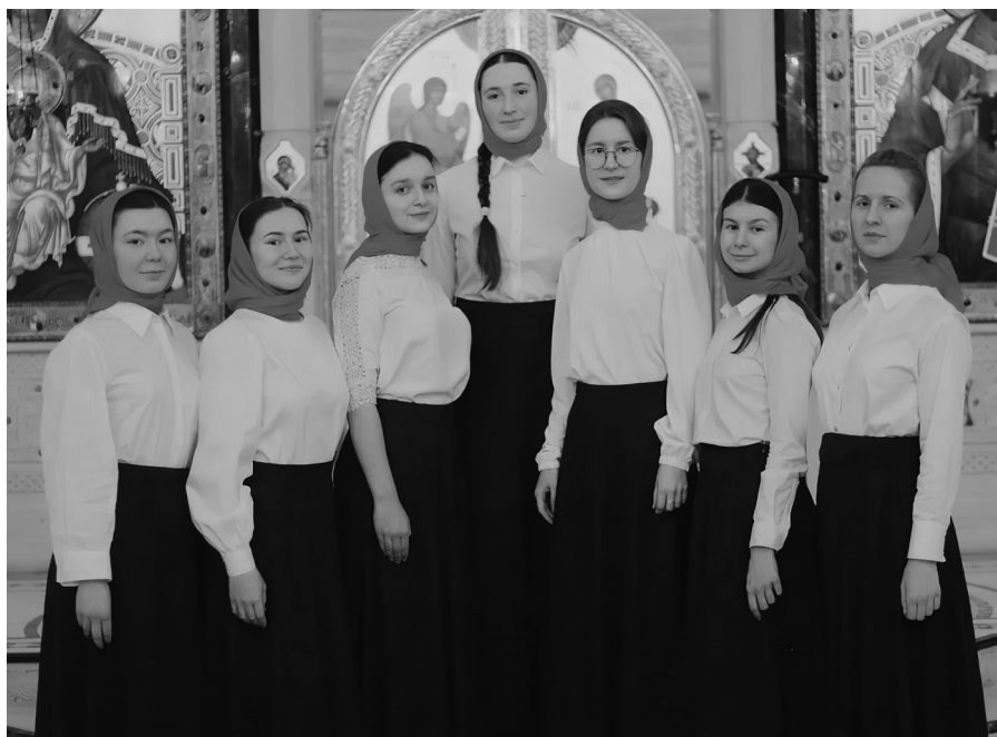
Пасха в Сретенском монастыре, Москва 2023 г.

В хозяйском дому там свечи горят, Христос воскрес, Сын Божия. Там свечи горят, иконы стоят, Христос воскрес, Сын Божия. Одна икона — Егорий свят, Христос воскрес, Сын Божия. Другая икона — Никола свят, Христос воскрес, Сын Божия. Егорий свят коров пасет, Христос воскрес, Сын Божия. Никола свят засекает яр, Христос воскрес, Сын Божия. В одной руке — коровы ялы, Христос воскрес, Сын Божия. В другой руке — ячмень златоус, Христос воскрес, Сын Божия.