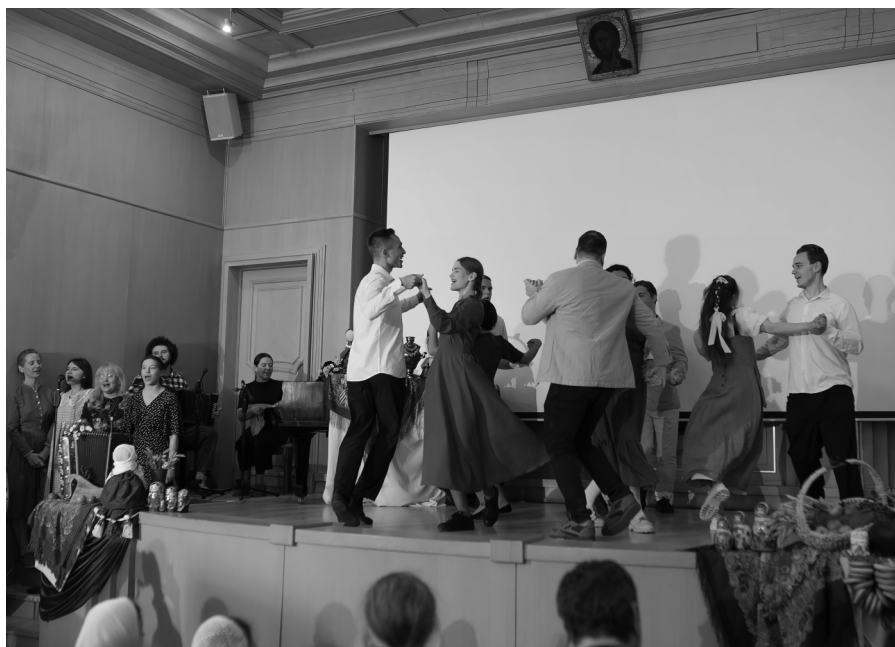
Выпускной концерт школы волонтера «Фольклор родной земли», Москва 2023г.

Русский, немец и поляк танцевали краковяк. Русский лучше немца выкидывал коленца. Русский прыгнул, немец тоже, русский ногу на носок. А поляк и так, и сяк — не выходит краковяк!