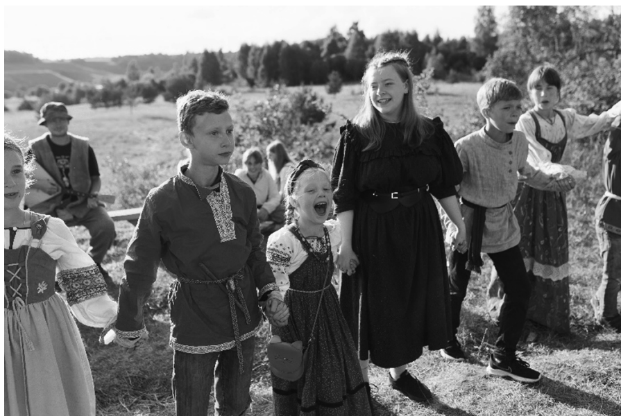
Экспедиция «Родной земли» во Псковскую область, деревня Изборск, русская народная вечерка в детском лагере «Русская земля», июль 2023г.