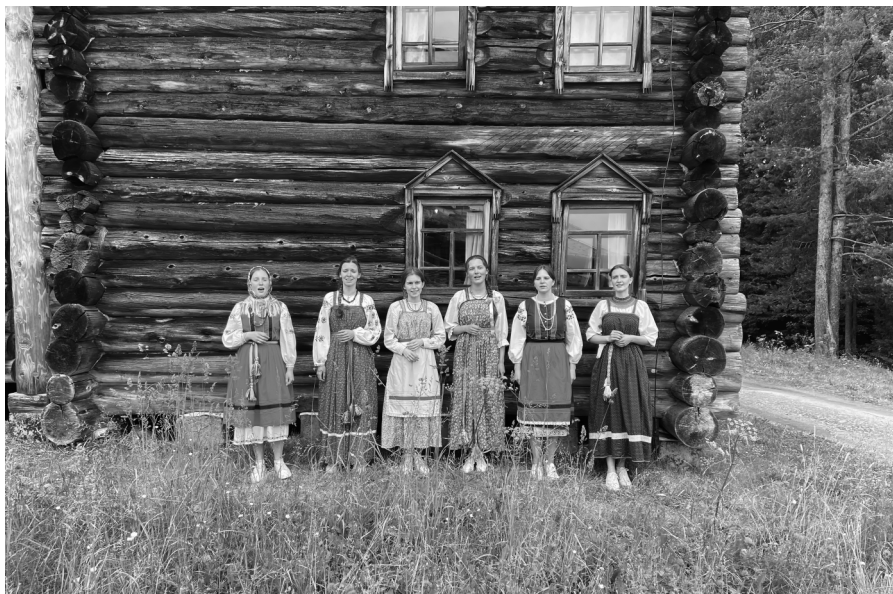
Экспедиция в Северодвинск, лето 2023 г.

Иди, утица, домой, Иди, серая, домой, У тя (тебя) семеро детей, Восьмой селезень, А девятая сама, Догони/ поцелуй разок меня.